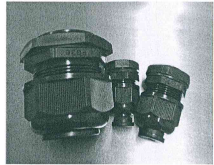
避光产品试验后照片